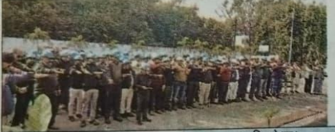
● नेपालगर / राज न्यूज नेटवर्क