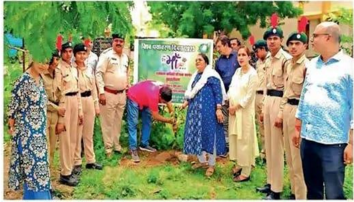
शासकीय कॉलेज में पौधारोपण किया गया।