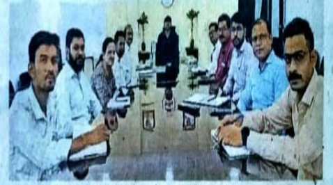
प्रशिक्षण में शामिल नेपा लिमिटेड के अधिकारी व कर्मचारी।