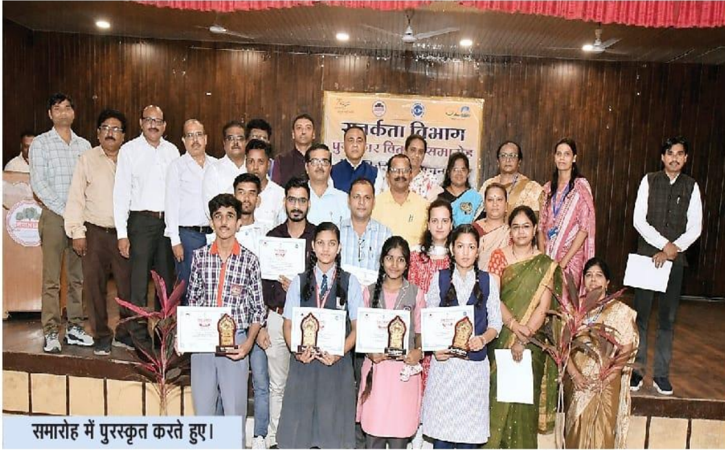
समारोह में पुरस्कृत करते हुए।