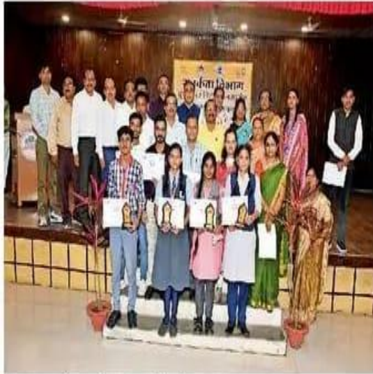
उत्कृष्ट प्रदर्शन करने पर सम्मानित किया गया